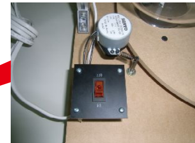
スイッチ及び回転用モーター

■ 二酸化炭素の増加が地球温暖化の重要な要因であることを理解してもらう為の説明用模型です。