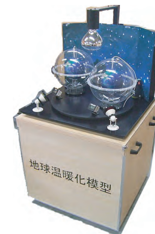
木製収納ケース付